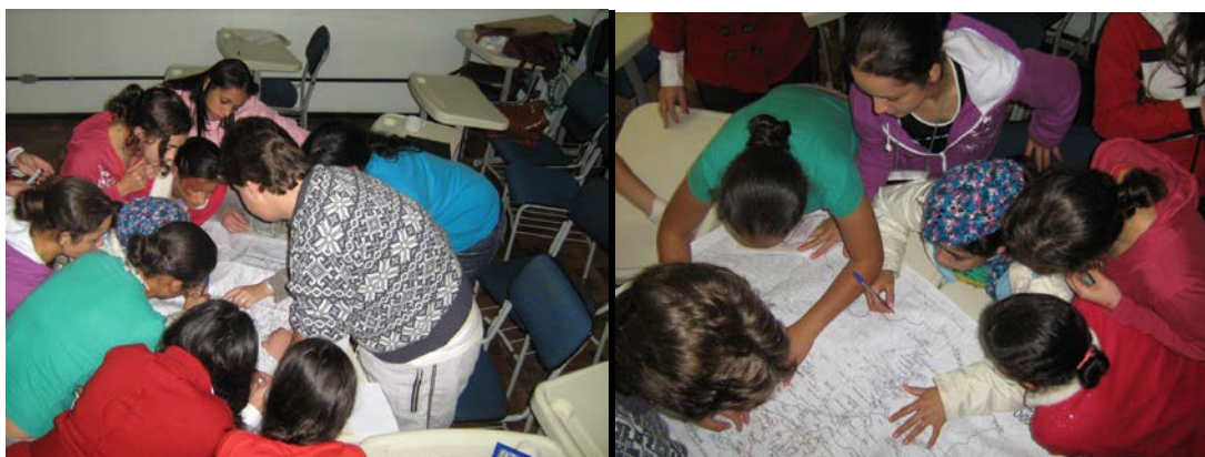
Figura 2 - Jovens elaborando o mapa de atividades produtivas, resultado da pesquisa/extensão