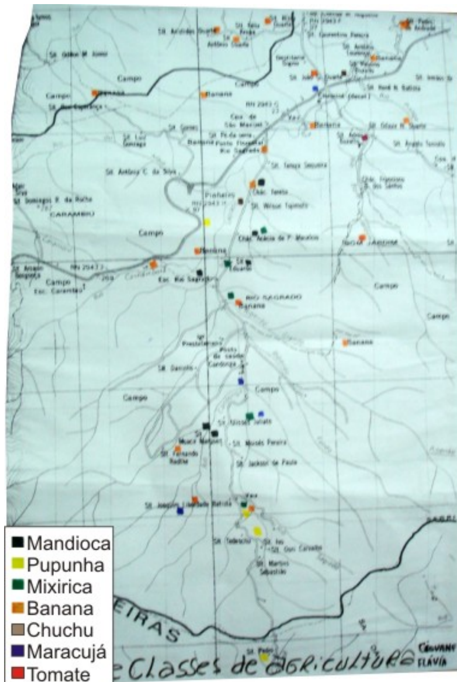
Figura 3 - Mapa de Classes de agricultura